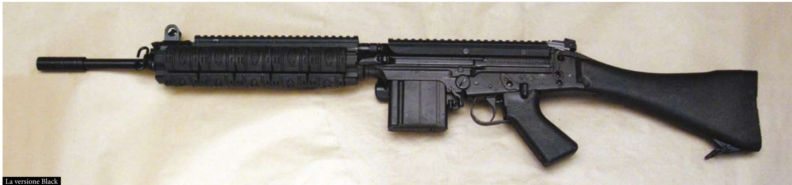
La versione Black