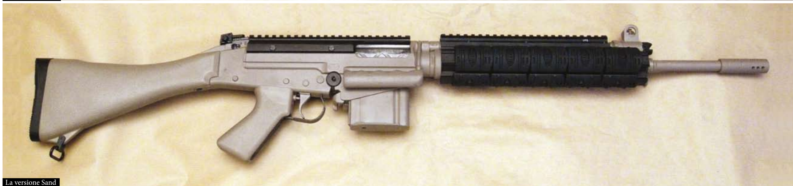
La versione Sand