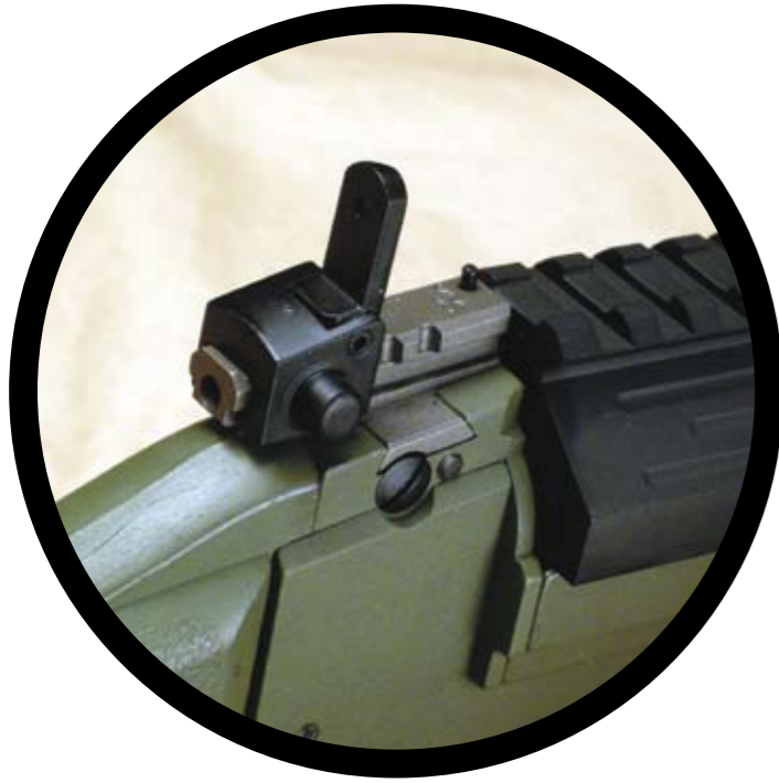
La diottra aperta, in posizione di tiro.