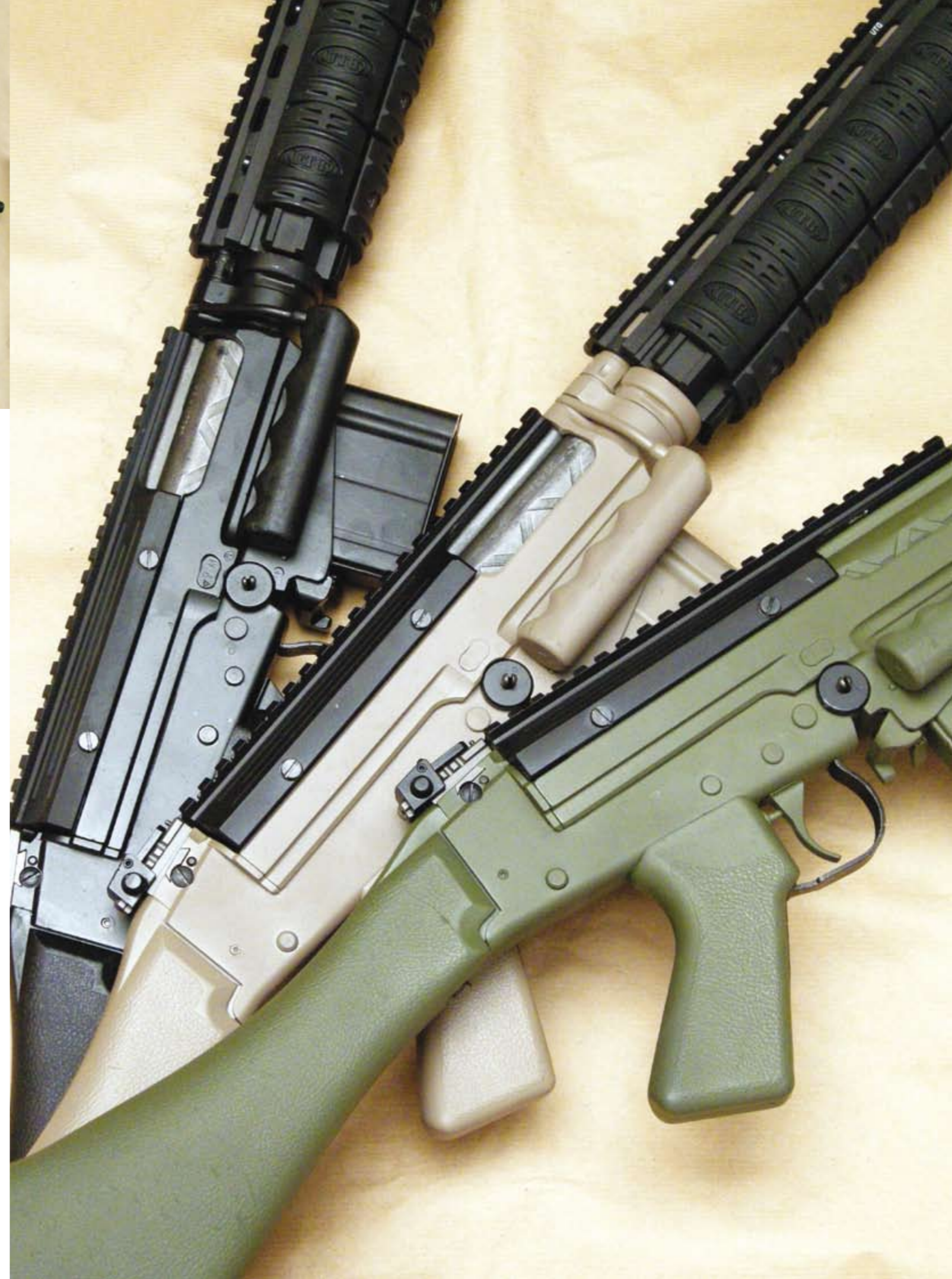
Foto 1. Un FAL in versione fucile (in alto) a confronto con uno dei "FAL corti" del servizio, in questo caso un Black con copricarica e astina originali. L'inconfondibile linea elegante rende sempre immediatamente riconoscibile l'FN FAL.

Si sa che dopo i battle rifles nacque l'era dei moderni fucili d'assalto di piccolo calibro (5,56x45, 5,45x39 ecc.), che oggi – esasperando al massimo il concetto di versatilità – sono diventati delle vere e proprie piattaforme su cui è possibile costruire un fucile adattato addirittura a livello individuale. Ci si potrebbe chiedere: se il FAL avesse proseguito la sua vita operativa, come sarebbe diventato? Domanda certamente dettata dalla curiosità che trova però risposta concreta in una serie di fucili allestiti dalla ditta Nuova Jager di Basaluzzo (AL). Si tratta, in buona sostanza, di un lotto di armi nuove in calibro 308 Winchester, monomatricola, con caricatore da 10 colpi, provenienti dalla riserva inglese (a seguito dell'adozione da parte dei britannici del fucile bull pup SA 80) che la Nuova Jager ha reso simili al raro modello Parà a canna corta o a un'analoga versione fatta dagli australiani. Oltre ad accorciare la canna a 18 pollici e a montarle il freno di bocca, la ditta alessandrina è andata oltre, facendo verniciare alcuni esemplari in colore verde ( Tactical Green ) o sabbia ( Sand ); la verniciatura con Gun Kote è stata eseguita dalla Brugar di Gardone Valtrompia, ditta