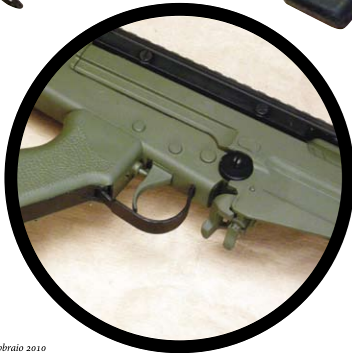
Un dettaglio del sistema di ritegno del caricatore nella sua sede.