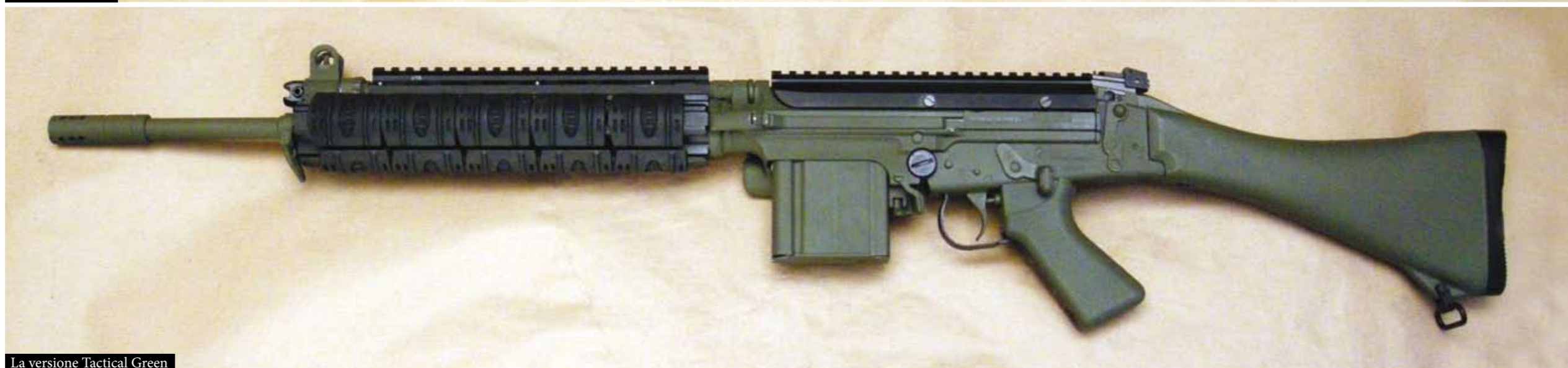
La versione Tactical Green