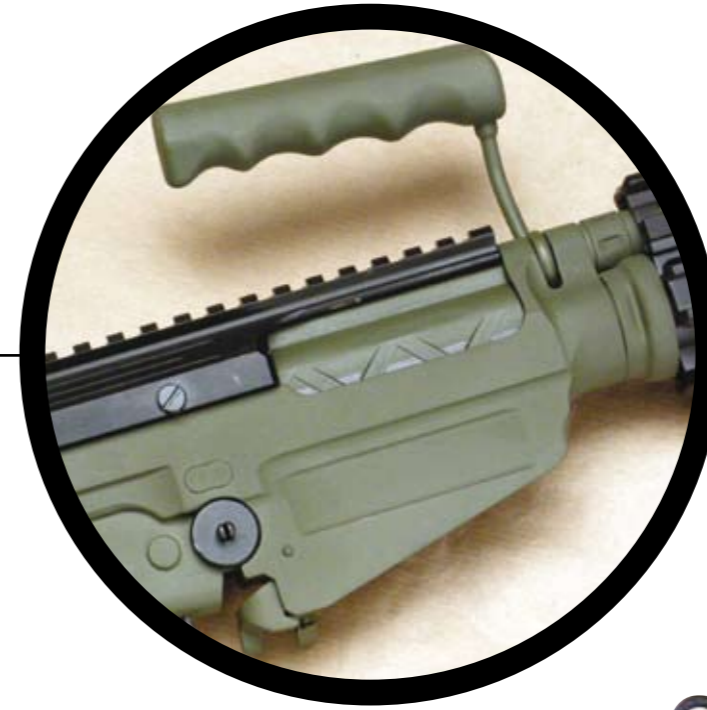
La maniglia di trasporto, in posizione di apertura.