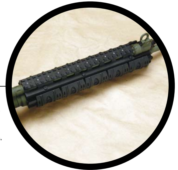
L'astina reca quattro slitte Picatinny; nella foto le due laterali e quella inferiore sono coperte dalle protezioni di plastica, facilmente staccabili.