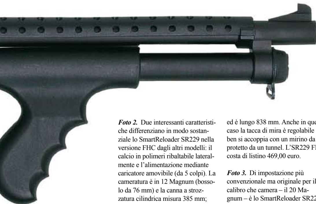
Foto 2. Due interessanti caratteristiche differenziano in modo sostanziale lo SmartReloader SR229 nella versione FHC dagli altri modelli: il calcio in polimeri ribaltabile lateralmente e l'alimentazione mediante caricatore amovibile (da 5 colpi). La cameratura è in 12 Magnum (bosso da 76 mm) e la canna a strozzatura cilindrica misura 385 mm; questo fucile a pompa pesa 3,5 kg

ed è lungo 838 mm. Anche in questo caso la tacca di mira è regolabile e ben si accoppia con un mirino da tiro protetto da un tunnel. L'SR229 FHC costa di listino 469,00 euro.