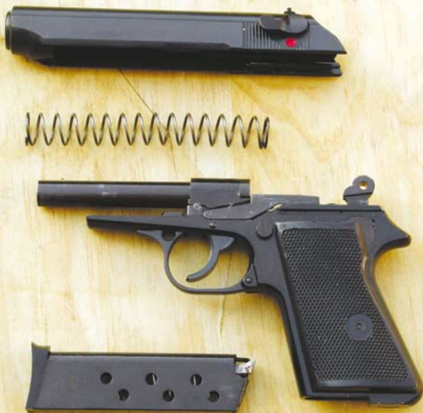
Foto 6. Lo smontaggio ordinario avviene

esattamente come per la Walther PP, abbassando il ramo anteriore del ponticello del grilletto. Dall'alto si notano: il carrello, la molla di recupero (che scorre lungo la canna), il fusto su cui è bloccata la canna stessa e il caricatore.